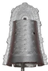
※手のひらに乗る大きさです