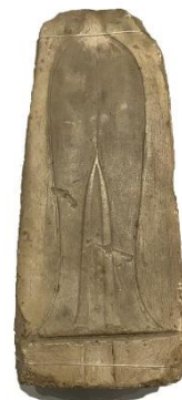
福岡県多田羅遺跡出土 広形銅戈石製鑄型 レプリカ