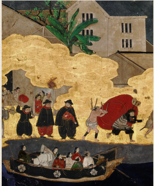
住吉祭礼図屏風(部分)

堺環濠都市遺跡は、戦国の世を中心に栄えた「堺」の街並みや生活を土中に残しています。数々の発掘調査成果で見つかった、「堺」の繁栄ぶりとその特徴を紹介します。