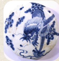
肥前染付 蓋 堺市文化財課所蔵

堺環濠都市遺跡で使われていた、兎や龍が描かれた器と、現代の紙工作作家が立体的に作ったいきもの作品を展示します。