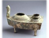
青銅竈（せいどうかまど） 【大阪府立弥生博物館蔵】